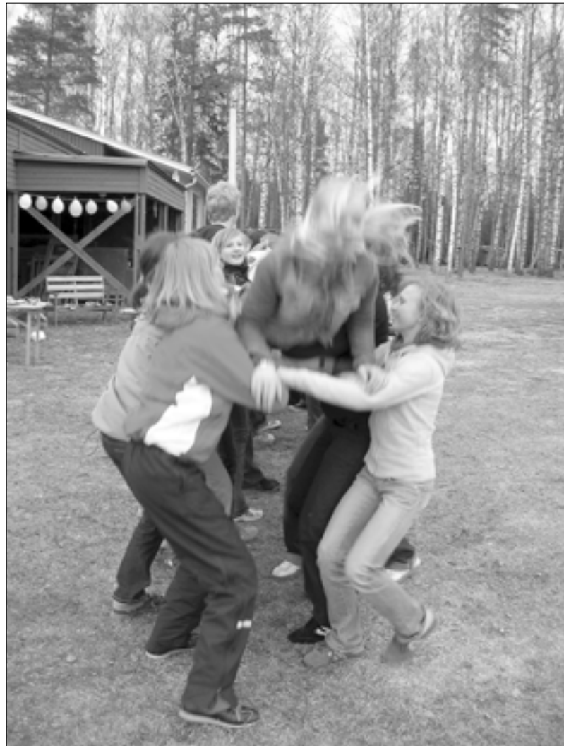
En av lekarna på vappenfesten gick ut på att man skulle lita på sina vänner och lagkamrater så mycket att man vågade kasta sig i deras famn.

Det blev lekfullt när ett tjugotal ungdomar samlades på Humle för att fira Vappen tillsammans, och trots att det var en aning kyligt i luften så tror jag ingen hann med att frysa. Det började med ett meddelande om att det fanns en regel för att man skulle få vara med på festen: man skulle fixa sin egen festhatt. En variation av hattar fanns det verkligen, några stora och några små, några omsorgsfullt gjorda och några slarvigt gjorda.