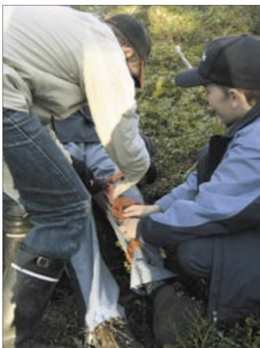
I en 3:e klass drill ingår bl a att klara av att ta hand om en skadad person.