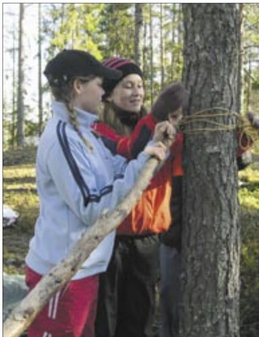
Surra behöver man kunna om man ska lyckas sätta upp ett vindskydd.