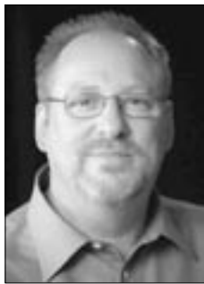
Rick Warren medverkar i konferensen.

– Jag var själv med på en BWA ungdomskonferens i Glasgow, Skottland, 1988. Då åkte en stor grupp ungdomar från Jakobstad med Interrail till England och Skottland. En sak jag bär med mig från den resan är den enorma känslan när paraden med representanter från alla länder tågade in. Insikten om att det finns baptister i alla världen hörn. Plötsligt blev man del av något större. Man var inte i minoritet längre och det gjorde gott åt självkänslan både som kristen och baptist. Sedan var de personliga mötena i mindre grupper, med personer från andra länder, spännande och roliga.