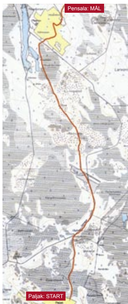
En kyrkvägsvandringen mellan Paljak och Pensala blir det söndagen den 19 juni. Ruten är utmärkt med rött.