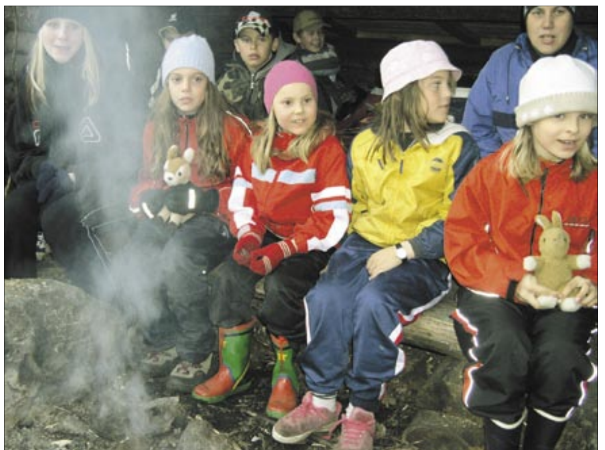
Esse stigfinnare avslutade terminen med en hajk vid Nådjärv.

På lördagsmorgonen och förmiddagen var det dags för den traditionella äventyrsleken mellan patrullerna. Vi blev uppdelade i nya