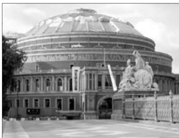
BWA-kongressen i London 1955 hölls Royal Albert Hall.